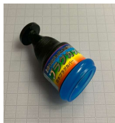
防水プラグカバー