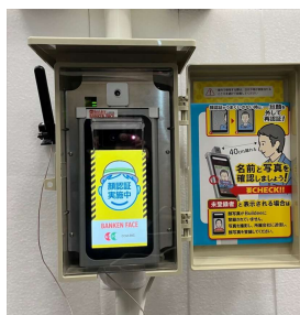
単管パイプに固定