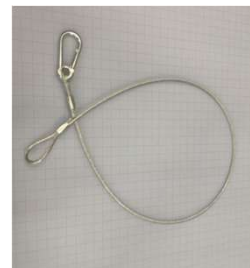
転倒防止ワイヤー